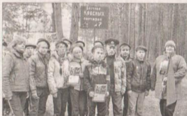
Застава № 7 - победитель первой игры.

Именно так можно назвать наш город применительно к проекту «Военно-патриотическая игра «Государственная граница»