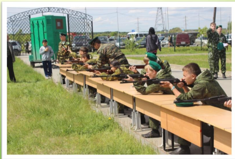
Стрельба из пневматической винтовки